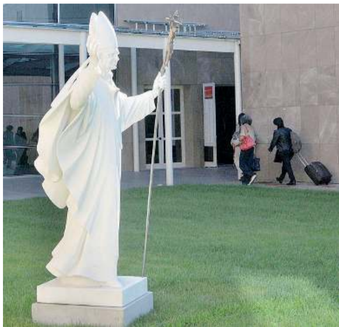
Concesio. Le lettere sono custodite all'Istituto Paolo VI

Il criterio fondamentale è stato quello di pubblicare tutti gli scritti epistolari e i manoscritti riconducibili a Montini. È quindi un criterio che mira alla completezza, per quanto sia umanamente raggiungibile. In effetti la raccolta dei documenti - lettere scritte da Montini e indirizzate a Montini - in originale o riprodotti è stato il primo ingente sforzo compiuto dall'Istituto Paolo VI all'indomani della sua costi-